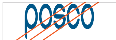
워드마크의 비례를 임의로 변경한 경우