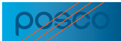
워드마크의 식별이 어려운 배경 색상 위에 적용한 경우