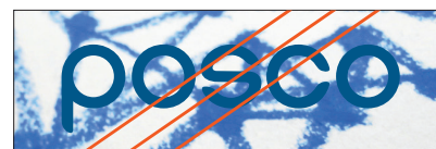
워드마크를 복잡한 이미지 위에 적용한 경우