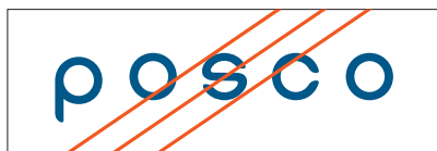
워드마크의 자간을 임의로 변형한 경우