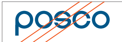
워드마크의 요소를 임의로 변경한 경우